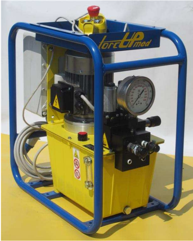
Centralina con controllo manuale