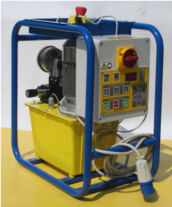
Centralina con controllo automatico