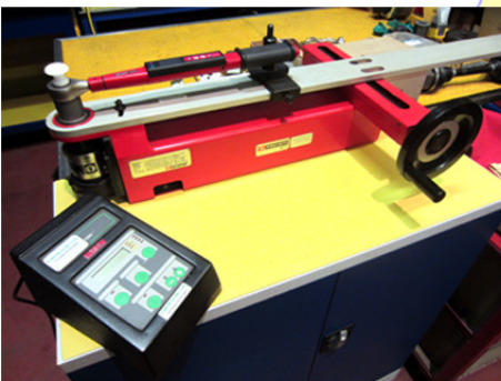
Calibrazione Chiavi Dinamometriche Manuali