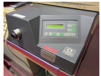
Banco freno per prove di durata con trasduttore COPPIA-ANGOLO (40.000Nm)